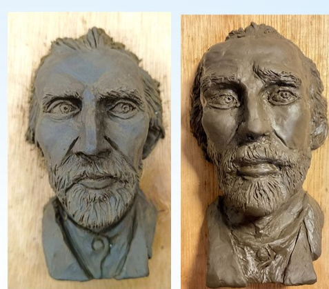
學生仿作梵谷厚浮雕作品