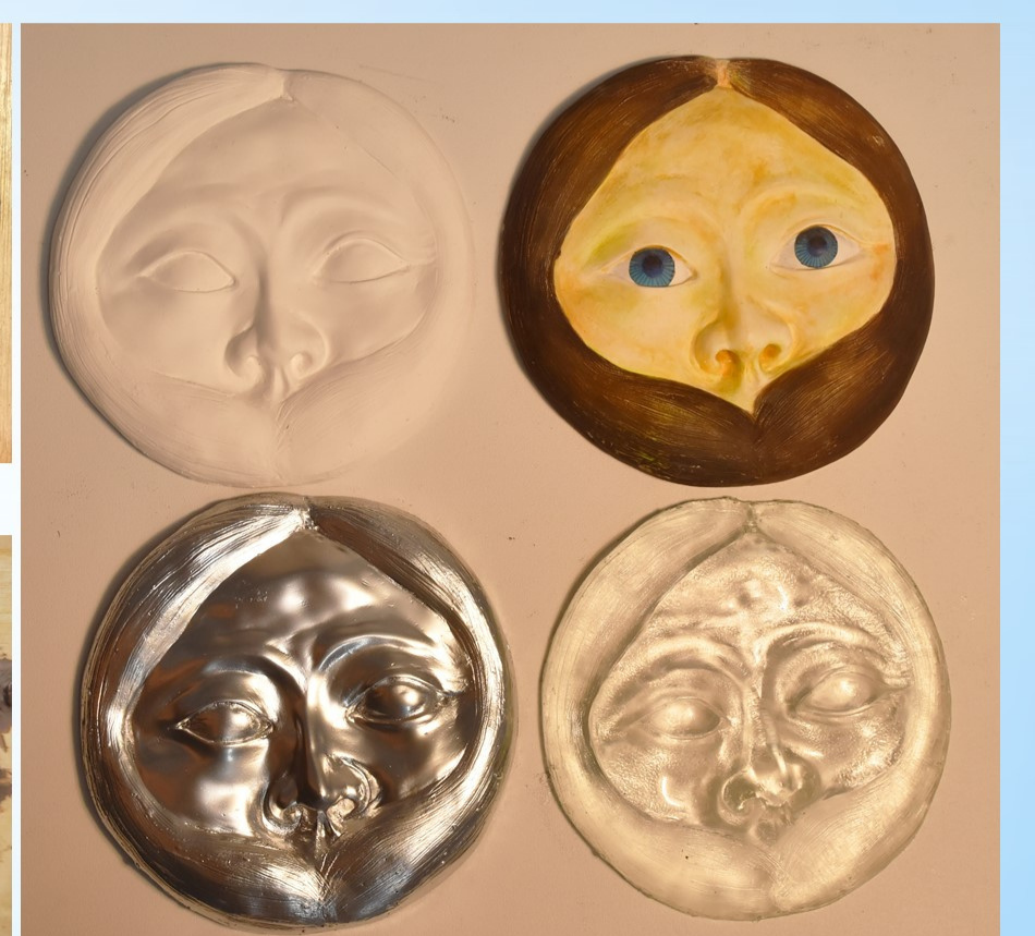
學生創作多元材質的藝術自塑像作品