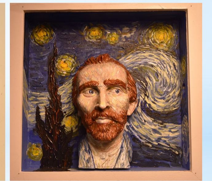
教師示範浮雕畫作品