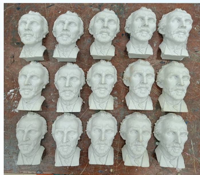
教師事先製作及複製足夠教學數量的梵谷厚浮雕