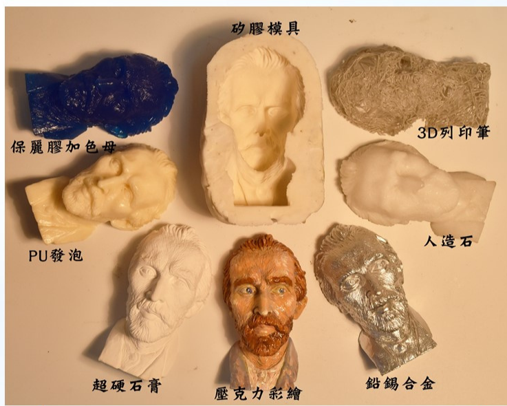
教師展示利用砂膠模，翻製出各式材質作品