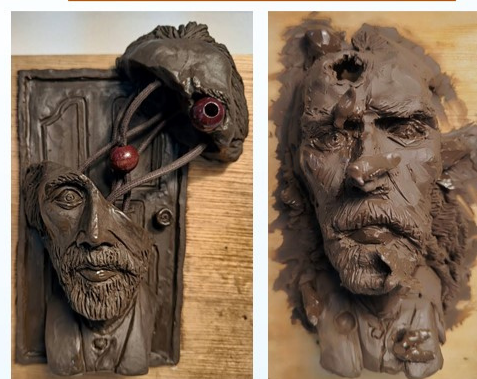
學生改造梵谷厚浮雕作品